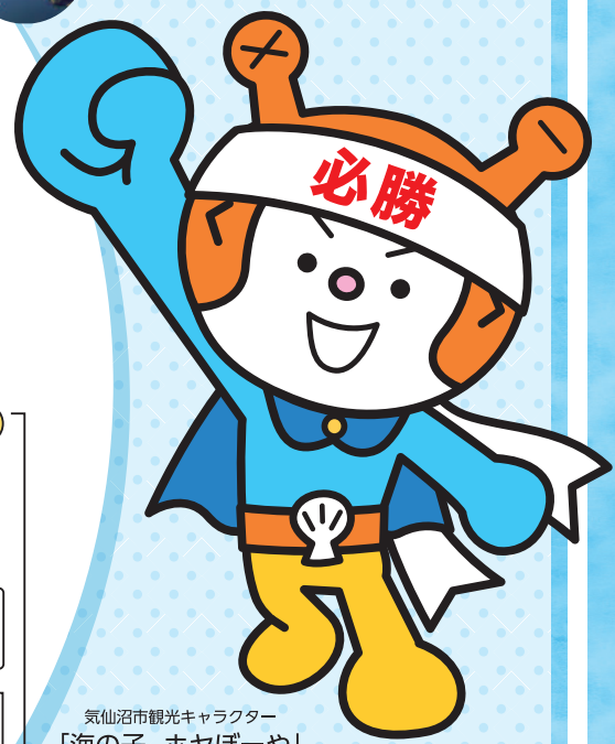
気仙沼市観光キャラクター「海の子 ホヤぼーヤ」